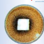
มีเชื้อแบคทีเรียเจริญเติบโตจำนวนมาก